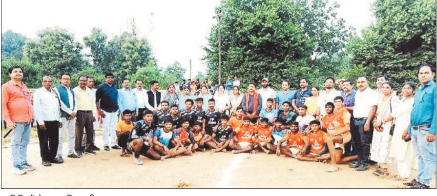
अतिथियों के साथ खिलाड़ी।

प्रतियोगिता में देवनगर की टीम ने बेहतरीन प्रदर्शन करते हुए कबड्डी के पुरुष और महिला दोनों वर्गों में जीत हासिल की, वहीं खो-खो में भी देवनगर की टीम ने अपना वर्चस्व कायम रखा। वॉलीबॉल प्रतियोगिता में रामानुजनगर की टीम